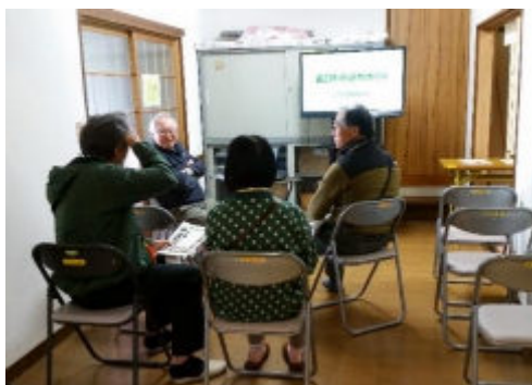
歴史研究会の「田口町石造物めぐり」スライドショー。補足説明する会長。