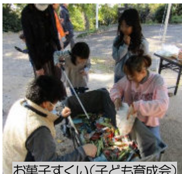
お菓子すくい (子ども育成会)