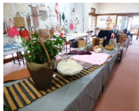
大きな作品もありました