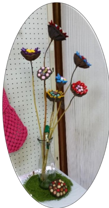
ハスの花托を利用した作品