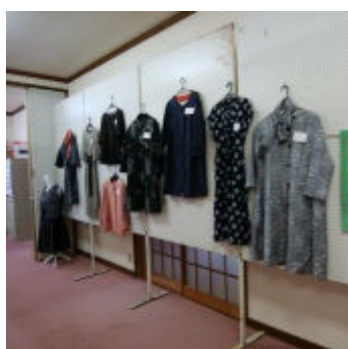
創造性に富んだ作品もあり ブティックのようでした