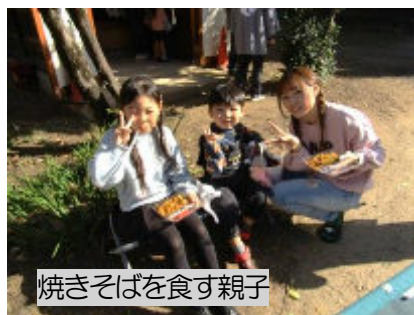
焼きそばを食す親子