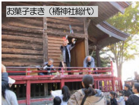
お菓子まき (橋神社総代)