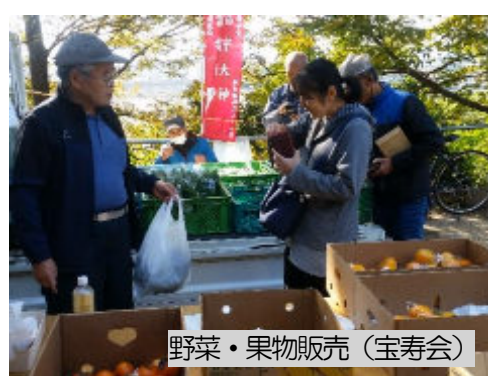
野菜・果物販売 (宝寿会)