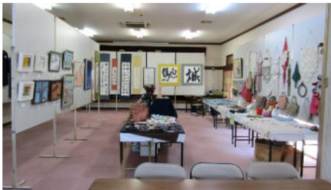
玄人はだしの作品がずらり