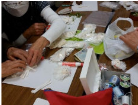
ロープ人形づくりとその完成を喜ぶ参加者