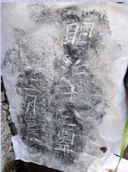
明治十八乙酉年 三月吉辰 (1885)