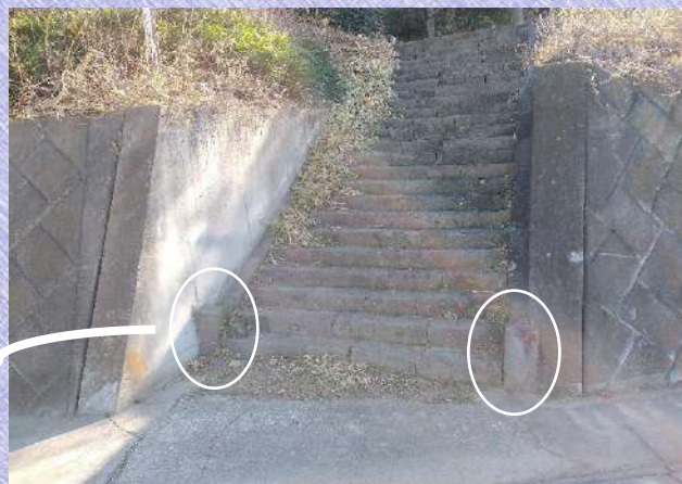
橘神社参道の石段