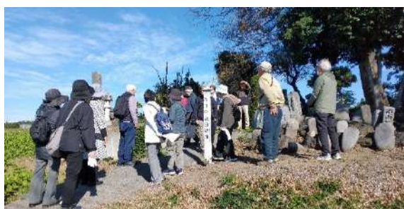
11月9日 歴史研究会の田口町散策 町内に存在する史跡などを中心に見学しました。