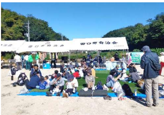
疲れを癒す参加者たち