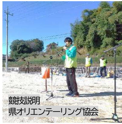
競技説明 県オリエンテーリング協会