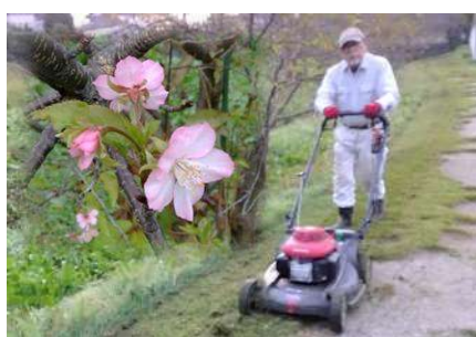
10月26日 桃ノ木川河川敷の草刈り (桃ノ木川を守る会) 気候変動の影響?カワツザクラが数輪咲いていました。