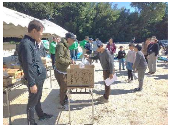
賞品のなかから欲しいものを選べる