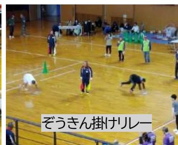
ぞうきん掛けリレー