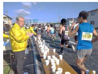
11月3日 ぐんまマラソンの給水ボランティア 自治会役員、スポ協、育成会、お助け隊によって行なわれました。