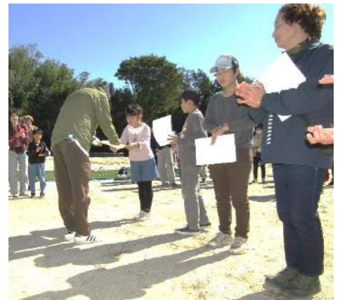
入賞者手前から1位、2位、3位