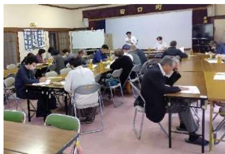
10月26日 宝寿会の健康講座 上武呼吸器科内科病院副院長による「予防接種の種類と効果」ほかの講演があり参加者は興味深く傾聴していました。