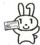
マイナンバー PRキャラクター 「マイナちゃん」

詳しくは市役所市民課マイナンバーカードコールセンター(電話898-6101)PRキャラクター にお問い合わせください。