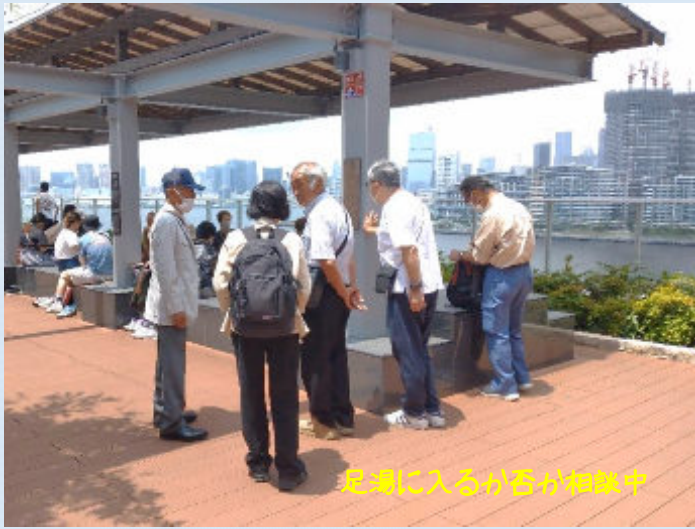
足湯に入るが番が相談中