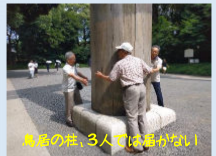
鳥居の柱、3人では届かない