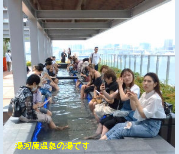
湯河原温泉の湯です