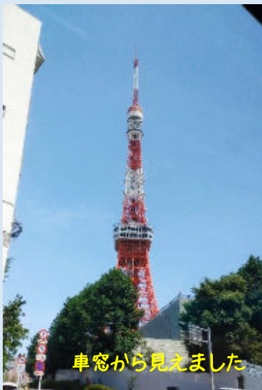
車窓から見えました