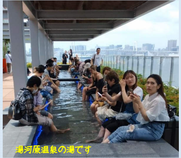
湯河原温泉の湯です