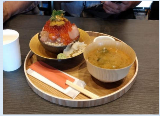
会長が注文したのは、「まるり丼」¥7,500でした