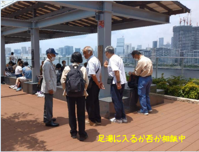
足湯に入るか否が相談中