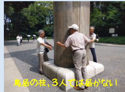
鳥居の柱、3人では届かない