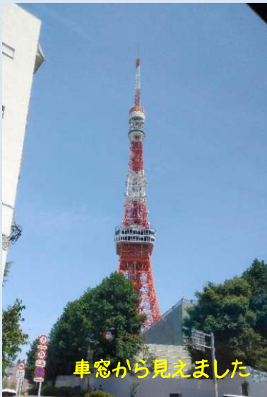
車窓から見えました